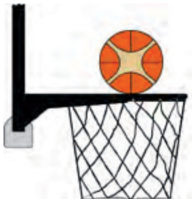
Diagrama 2 - Balón en contacto con el aro

31-15 Situación. Se produce una interferencia si un defensor o un atacante tocan la canasta o el tablero durante un lanzamiento a cesto mientras el balón está en contacto con el aro y aún tiene la posibilidad de entrar en el cesto.